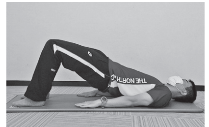
▲体勢が悪いと効果が減少します。正しい姿勢で行いましょう。

●お問い合わせ先 甲佐町フィットネスセンター (町総合保健福祉センター内) ☎096-235-8712