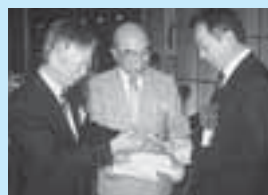
東京甲佐会から奥名町長に目録を贈呈