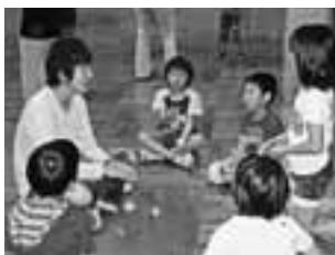
▲大学生に習って、お手玉を練習する子どもたち

生たちによるジャグリングの模範演技を見ました。ジャグリングとは、ボールを使ったり、ディアポロ(中