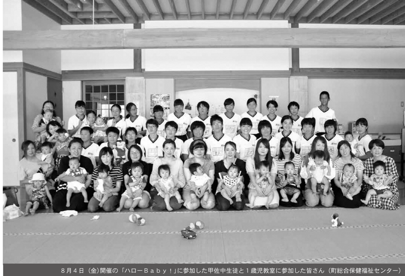
8月4日(金)開催の「ハローBaby!」に参加した甲佐中生徒と1歳児教室に参加した皆さん(町総合保健福祉センター)

酷暑と大雨が混ざり合う、不安定な天候に覆われた今夏。全国では被害に遭った地域もあり、本町も厳しい暑さと激しいゲリラ豪雨に見舞われました。 夏休みを機に成長する子どもたち。町の事業は天候に恵まれ、子育て学習や自然体験など盛りだくさん。夏の思い出を糧に、実りの秋へと向かうことでしょうか。時期を同じくして、特集で紹介した「こうさてんプロジェクト」も開催。地域の宝と魅力をつなぎ、町内外の皆さんが交流人口増対策案を出し合う試み。地域の方から町外の大学生までが地域を散策して、老若男女の幅広い視点で地域を楽しみながら交流するアイデアに頭をひねり、企画案を練り上げています。 夜長月とも呼ばれる9月の爽やかな夜。夏の思い出とともに地域の魅力に思いを巡らすひと時を過ごしてみませんか。(係)