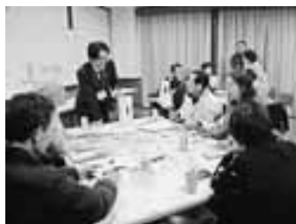
▲昨年度に町民が参加して開催された特産品開発ワークショップ