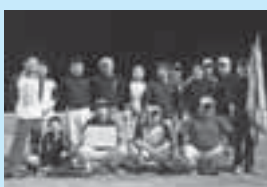
▶優勝した倶楽部乙女