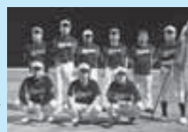
▶優勝した白旗クラブ