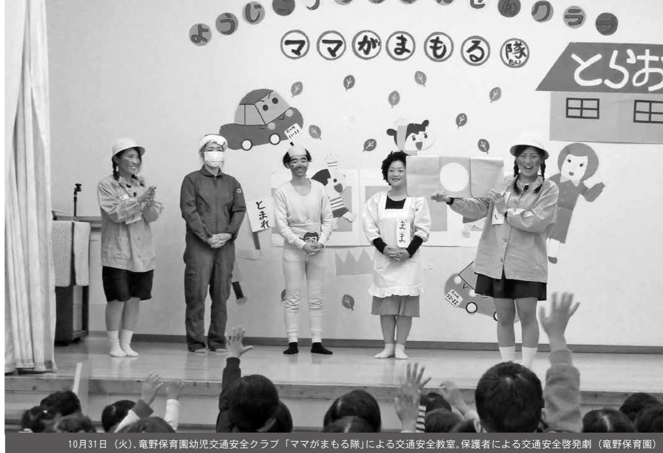
10月31日(火)、竜野保育園幼児交通安全クラブ「ママがまもる隊」による交通安全教室。保護者による交通安全啓発劇(竜野保育園)

編集後記 11月12日(日)の産業文化祭では、秋晴れの下、会場となった町生涯学習センター、役場駐車場などは大勢の人たちで賑わいました。 恒例のニラ飛ばしでは、大人も子どももニラに関することを『ニラ大好き!』などと叫んで飛ばします。2投チャレンジでき、うまく風に乗ると遠くまで飛ばります。ただし、どんなに遠くに飛んでもコースを外ればアウトとなります。 参加された皆さんは上手に飛ばされていましたが、残念ながら世界記録・甲佐記録の更新とはなりません。 私も1日、カメラを手に多くのイベントや展示品、ステージなどを参加された皆さんと一緒に楽しみましたが、撮影に夢中で1,000人ニラ鍋を食べ損なってしまったのがとても心残りです。