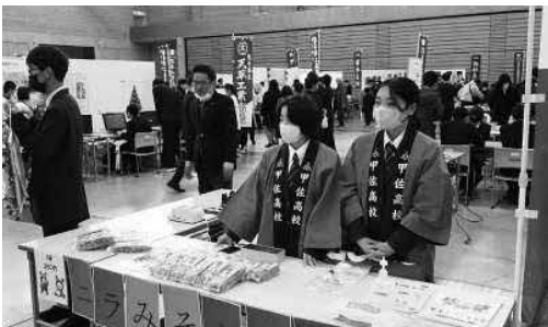
▲普通科福祉教養コースによる点字・オセロ体験（上）とビジネス情報科による「ニラみそあられ」の販売（下）