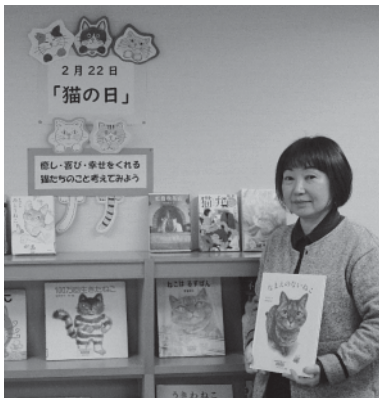
▲猫の日特集コーナーにぜひお越しください