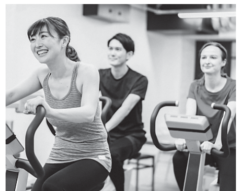
▲甲佐町フィットネスセンターにぜひお越しください