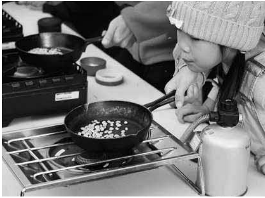
▲コーヒー豆の焙煎を体験する参加者