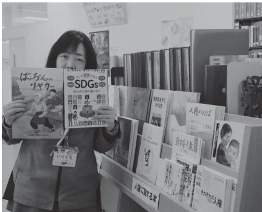
▲町生涯学習センター図書室内の人権コーナー

SDGsとは?「持続可能な開発目標」 長い歴史の中で世界は発展を続け、日本も豊かな国になりました。しかし