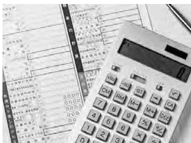
詳しくは町住民生活課までお尋ねください