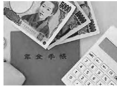
詳しくは町住民生活課までお尋ねください

11300円割引 (納付額9万7990円) ●現金およびクレジットカード納付の場合