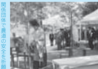
関係団体が農道の安全を祈願

21キロ。地域の基幹農道として、生産地と農業関連施設を結びとともに、全国各地への農産物の流通ルートを確認することを目的に整備されました。