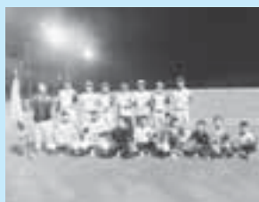
優勝した乙女タイギヤース