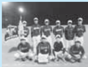
優勝した白旗クラブ