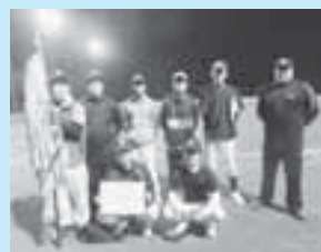
優勝した横田ソフト