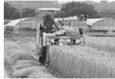
対象要件などを確認の上申請してください