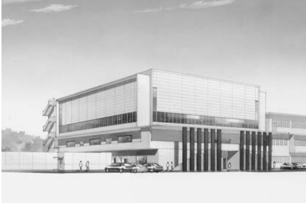
▲来年3月に完成が予定されている甲佐中学校体育館の完成予想図