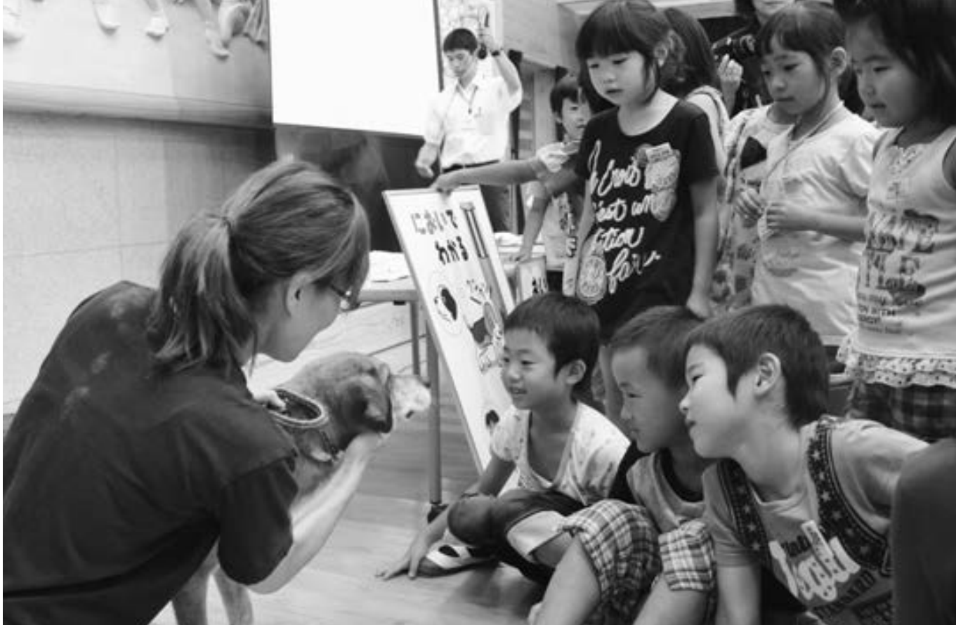
犬と触れ合う（甲佐小学校）