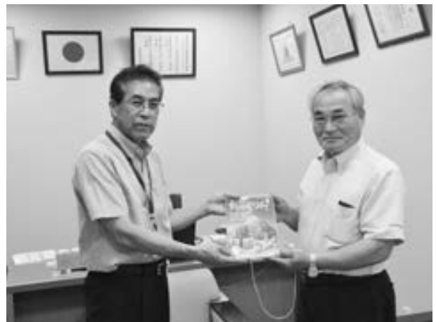
▲上益城農業協同組合が『ちやぐりん』を贈呈