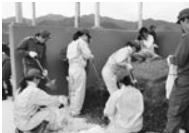
土のうを作る女性消防団員