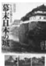
山川出版社 娯楽教養

幕末の秘蔵写真でよみがえる往時の城。近年各地で見つかった古写真を一挙に掲載し、134城を720点の写真で紹介。1877年に西南戦争で焼失する直前の熊本城の写真もある。明治の取り壊しは免れたが、修理されることなく放置されたため荒廃していますが、それでもなお雄々しい姿の熊本城を見ることができ、見応えのある1冊です。