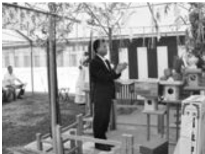
▲体育館建築工事の安全を祈願する奥名町長