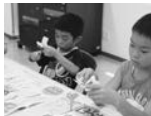
▲ペーパークラフトに挑戦するこどもたち

折りや谷折りをして、のりを付けながら立体的に仕上げていきます。各パーツができあがったら、全てを組み立てて完成です。参加した小学生は、「とても難しかったけど、できあがったらうれしかった」と、自分が作った作品を大事に持って帰りました。