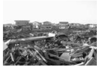
地震などの大災害時に発表されます（イメージ）