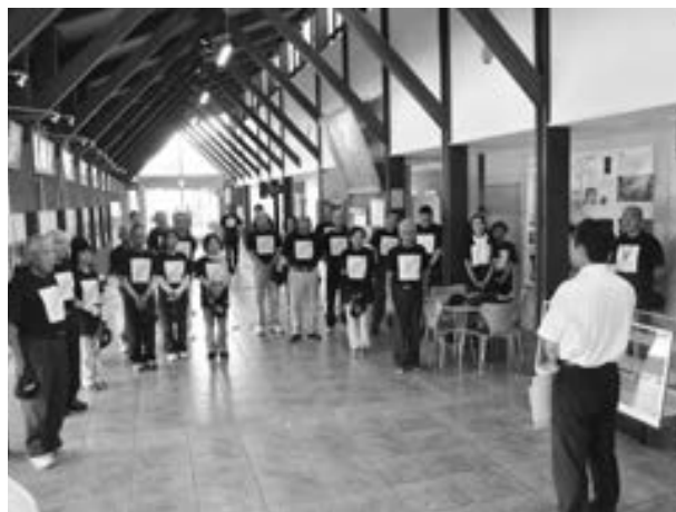
▲町役場を訪問する上益城地区保護司会御船分会