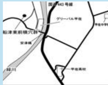
グリーンパル甲佐から車で約1分です

造になっています。横穴自体は全国的に広く造られていますが、この構造は熊本県特有のもので、船津東前横穴群は作られたときの様子をよく残しています。残念ながら発掘調査などは行われていませんので、どのような人たちが埋葬されていたかは分かっていませんが、同時期に多く作られていますので、一般の人々の墓という見方が強いです。このような墓は、ほかに下豊内や中山でも見られます。