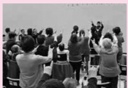
◀うきうき体操の様子