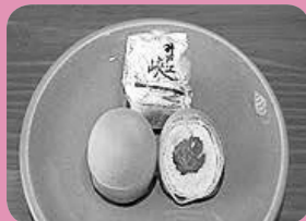
「井戸江味万十」こうさんもん No. 11 青梅の甘露煮を丸ごと1個使用

ふるさと納税のお礼の品として贈呈している本町の特産品ブランド「こうさんもん」を紹介します。