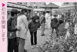
▶初市を開催します

甲佐町商工会では、春の訪れを知らせる祭り「第350回甲佐初市」を3月10日(土)・11日(日)に開催します。ぜひお越しください。