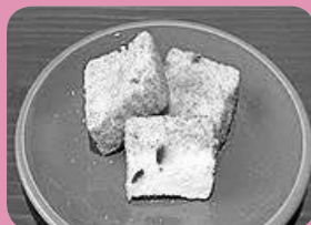
「マシュマロ詰の里」こうさんもん No. 12 カステラの角切り入りで何とも言えない食感