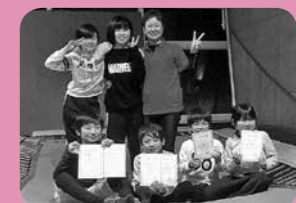
トランポリン教室