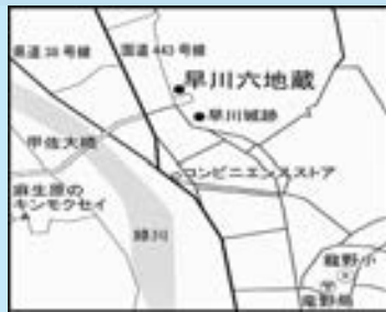
▶早川城跡のすぐ近くにありま

町内にはこのほかにも、西寒野・下横田・船津・南三箇・下田口・山出地区にあります。治安の乱れや疫病、飢饉(ききん)など、民衆の不安を背景に数多く建てられた六地藏は、当時の信仰を如実に示しています。