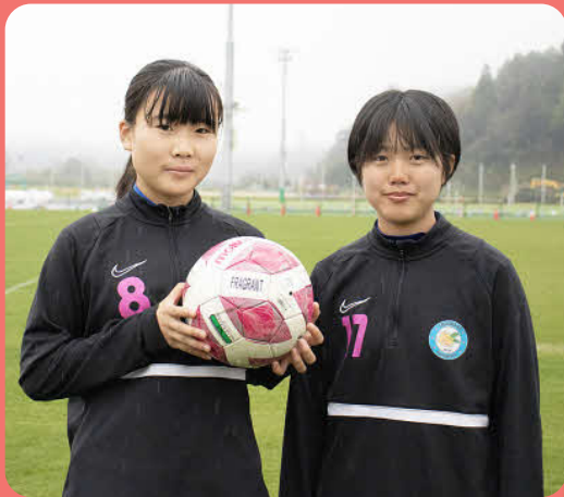
女子中学生サッカークラブチーム Fragrant熊本 所属