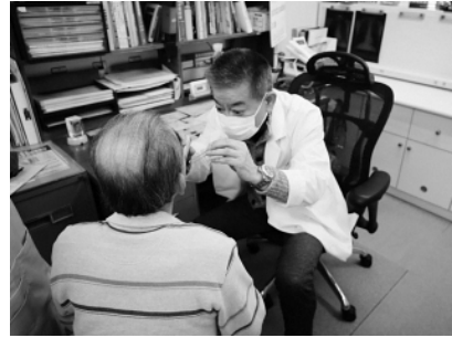
詳しくは町住民生活課におたずねください