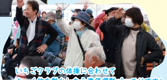
いちごクラブの体操に合わせて よく体を動かしたら準備運動バッチリです！

「あいにくの雨模様ですが 元気いっぱい楽しみましょう！」 と、町長からの開式のことで 始まりました！！