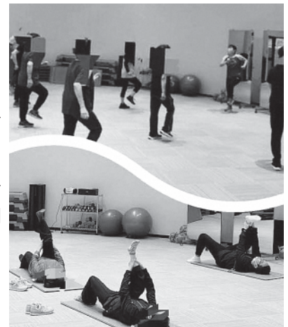
▲甲佐町フィットネスセンターにぜひお越しください

※教室プログラムの内容と実施時間帯については、フィットネスセンターにお問い合わせください。