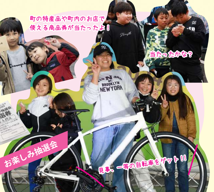
見事、一等の自転車をゲット！！