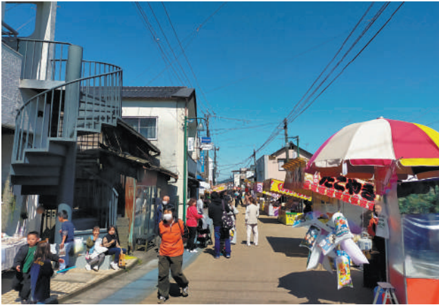
▲多くの屋台と見物客で賑わいをみせる商店街