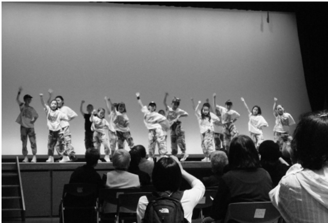
▲昨年の公民館自主講座学習発表会の様子

町公民館では、4月20日(土)町生涯学習センター・ホール及びギャラリーモールにて、公民館自主講座学習発表会を開催します。