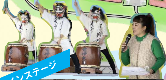
迫力満点！ 竜神太鼓のみなさん