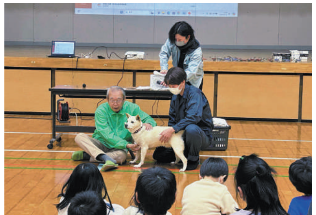
▲拡張心音計を使って、犬の心音を聴く白旗小の児童

1月29日（月）に甲佐町生涯学習センターで、第4回「緑川竜野川内水対策会議」が開催されました。同会議は、国土交通省熊本河川国道事務所および熊本県、甲佐町が、緑川と竜野川の合流点付近などの現状を共有し浸水被害などを軽減するための対策を推進することを目的として設立。今回は、豪雨被害の状況の報告や流域治水に関する協議・調整が行われました。