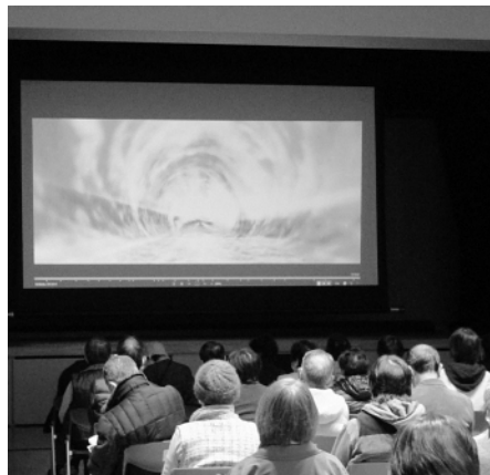
▲映画「破戒」に見入る参加者たち