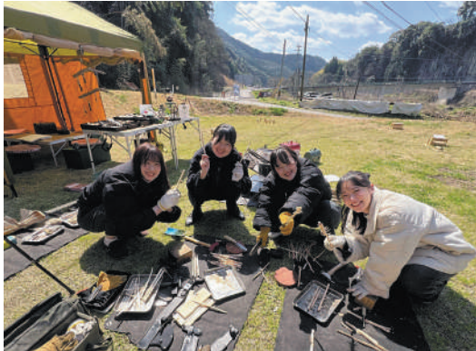
▲インターンシップ中の病院での講義（上）とCOMMON IDOEでの研修（下）の様子

また、医療の現場だけでなく、谷田病院が行う、まちづくりに関する事業などを学ぶため、町内各所を視察。商業施設での研修や農作業にも従事しました。学生の1人は「効率化されたシステムチックな医療ではなく、どのように暮らしていくことが患者の幸せにつながるかという点まで考えられていた。住民との距離が近く、地域と病院が密に連携している印象を受け、価値観が一変した。」と話しました。今後4人は、医療業界などへの就職を目指します。