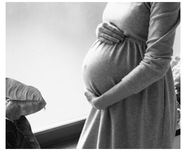
詳しくは町住民生活課までお尋ねください

国民年金第1号被保険者が出産の際に、出産前後の一定期間の国民年金保険料が免除される制度があります。