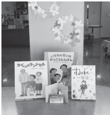
▲新入学のみなさんにお勧めのコーナー

■入園・入学・進級おめでとうございます 甲佐町生涯学習センター図書室の「利用者カード」は、小学校一年生以上でお申し込みをされた方に発行しています。小学校新一年生の皆さん、ぜひ自分の利用者カードを作って、たくさん本を読んでください。今月は新入学のみなさんにおすすめの本のコーナーを作りました。学校のことかわかる本や、楽しい物語