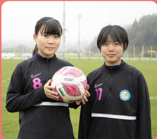
女子中学生サッカークラブチーム Fragrant熊本 所属