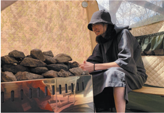
▲青空の見えるロケーションでテントサウナを楽しむ