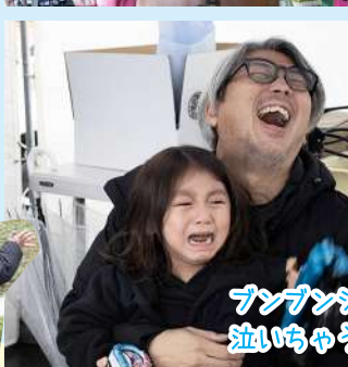
フンフンジャンションが怖くて 泣いちゃう子も