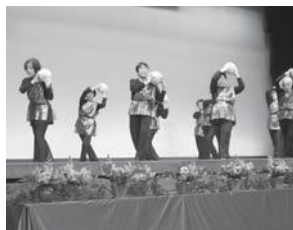
▲ステージで3B体操を披露する参加者

講座。 たくさんさんの作品の中から選りすぐった一品が展示され、見学者が気に入った作