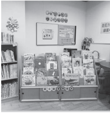
▲県立図書館配本コーナーにぜひお越しください

県立図書館配本コーナーの紹介 甲佐町生涯学習センター図書室は、熊本県立図書館の「配本協力図書」を利用してあります。一般書100冊、児童書・絵本200冊、合計300冊を借り受け、貸し出しています。1セット50冊で6箱分の図書は、年に数回入れ替わるので、箱を開けるたびに「今度はどんな本が届いたのだろう」と職員もワクワクしながら