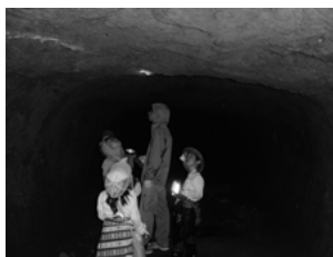
▲洞窟へ行くときは、必ず大人の人と一緒に行ってください

11月の講座は、11月16日(日) 下豊内区の洞窟(どうくつ)を探検しました。町生涯学習センターから徒歩で向かい、洞窟の入口まではしごを使って登りました。子どもたちは、真っ暗な穴の中にどんな生き物がいるのか壁に光を当てたり、水がたまっている箇所や洞窟の中の気温などを感じ