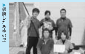
優勝したあゆの里