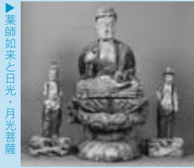
▶薬師如来と日光・月光菩薩

目野薬師如来および十二神将像は、中横田の目野地域にあります。薬師如来は、病を治し、苦しみから救う医薬の仏として古くから信仰されてきました。