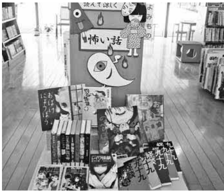
▲特集コーナーにぜひお越しください

怖い話・怪談特集コーナーの紹介 「夏の夜と言えば？」という問いに、怖い話や怪談を思い浮かべられる人は少なくないと思います。日本の文化や慣習によるものかもしれませんね。そこで、今月は「怖い話・怪談特集コーナー」を作りました。子どもたちが大好きな怖い絵本や児童書、