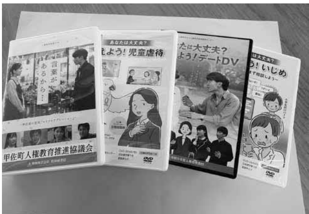
▲人権学習の教材などでお役立てください

その他、「あなたは大丈夫? 考えよう! デートDV」(約30分)、「あなたは大丈夫? 考えよう! 児童虐待」(約33分・アニメ)、「あなたは大丈夫? 考えよう! いじめ ～一人で悩まず相談しよう～」(約30分・アニメ)をはじめ