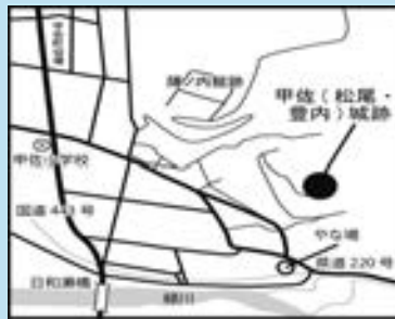
甲佐神社に続く道の要所に位置します

地域の要所に築かれた甲佐城は、その後城主を代え存続しました。その城下には町が形成され、現在の豊内地域の基礎ができました。