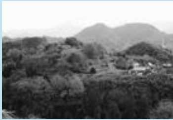
西から見た甲佐城跡遠景

甲佐城跡は、自然地形を利用した上豊内にある城跡で、標高90mの丘陵上に築かれています。戦国時代の武将・伊津野秀勝の子である山城守が在城したといわれ、