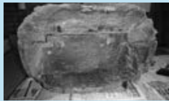
◀木造如来形座像の裏側

数多くあったであろう中世以前の仏像は、本町では三体しか確認されていません。祖先が残した遺産を、私たちは大切に後世に残していかなければなりません。