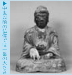
▶中世以前の仏像では一番の大きさ

上揚にある町指定文化財の木造如来形座像は、クスノキで作られた一木造で、中世以前の仏像では本町で一番大きく、高さは83㍺、膝の部分の幅は62㍺ほどあります。