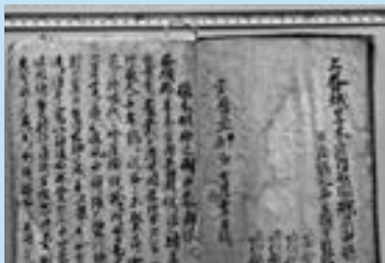
▶地域の歴史が記された緒方家文書

町文化財「緒方家文書」は、糸田にある古文書群で、江戸時代から昭和初期までの記録が確認されています。地域の庄屋文書として、藩や地域住民とのやり取りのほ