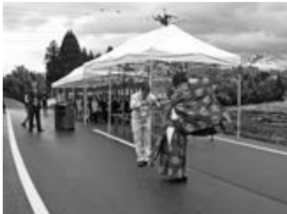
▲開通式に先立って行われた神事式