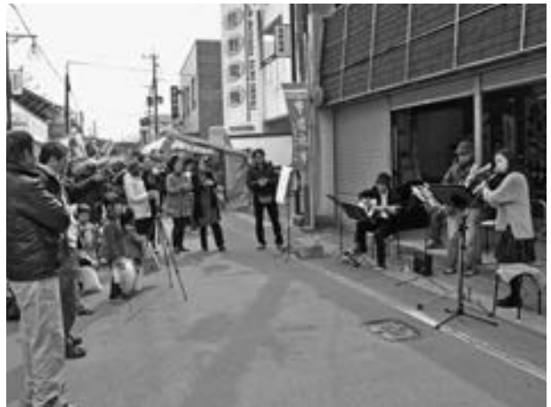
▲商工会女性部によるギターとフルートの演奏