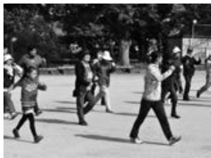
▲ウォーキングの基本指導を受ける参加者

3月16日(日) 甲佐町健康ウォーキング教室を開催。参加者27人は、ウォーキングの