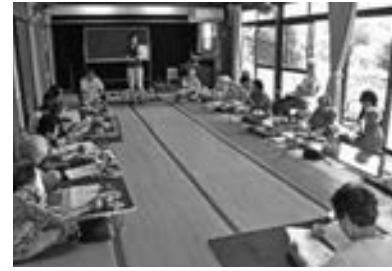
高齢者を支える後期高齢者医療（写真はイメージ）

対象者は次のとおりです。このうち、均等割額の5割軽減と2割軽減の対象者が拡大されました。