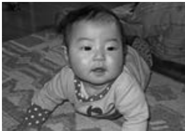
娘の育児を終え、職場復帰する妻に協力したい

と思うていた以上に大変で、それと育児を両立するとなると、大変な労力が必要だと感じていました。