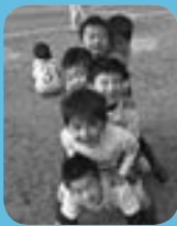
サッカー教室の子どもたち