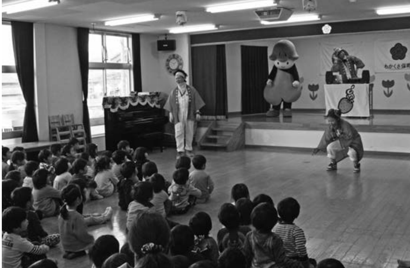
県人権啓発キャラクター「コッコロ」と学ぶ、思いやりの心（若草保育園）