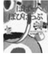
クレヨンハウス 絵本

「ぼぱぺ ぼびぱび ぼぱぼぱび ぱべぱ ぶべ？びびびー びびーぱ ぽーぺー びぶべぺ」。ふしぎなことばですが、まあまあ、ためしに読んでみて。赤ちゃんが好きなのは、この音だったんです！明るい色彩のやわらかな「かたち」と、楽しい「音」のことば。赤ちゃんと一緒に、自由にのびのび楽しんでください。0歳児からの絵本。