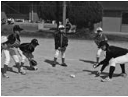
▲講師の指導の下、ボールの捕り方などを練習

講師に、東海大学九州硬式野球部の監督、コーチ、選手25人を迎え、小学生68人が参加。ボールの捕り方などを練習しました。