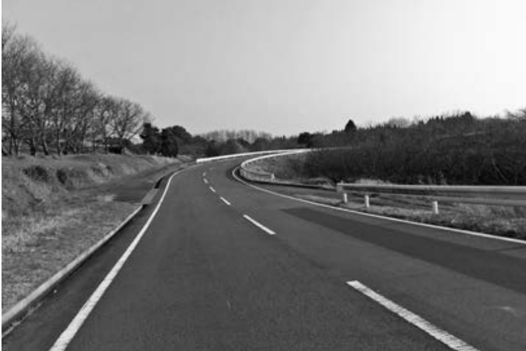
地域の基幹農道として整備され、全面開通した乙女・大沢水地区農免農道