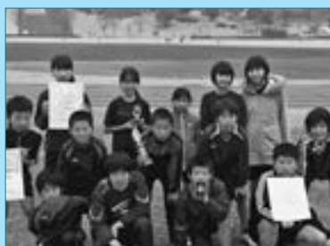
▲熊本市駅伝に出場した町内の小学生

は13チームが出場。「甲佐JRC」の男子チームが18分34秒で優勝し、「甲佐ジュニア・アスリート・クラブ」が19分24秒で4位でした。