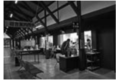
町住民生活課で申請してください