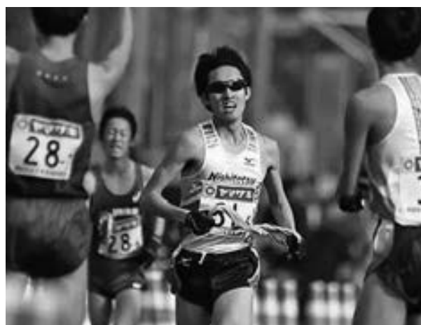
▲6区を力走した久佐賀競技者（写真中央）