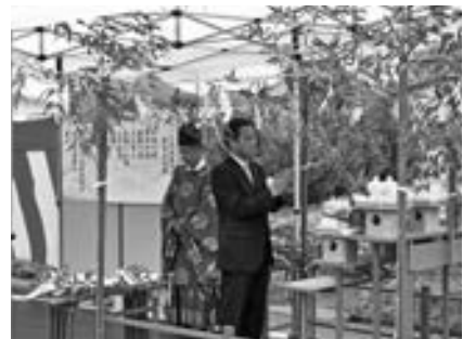
▲農道の安全を祈願する奥名会長