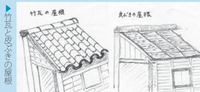
竹瓦と皮ぶきの屋根

今、山の頂まで植林された山々が広がるが、奥山に暮らす人々の辛苦(しんく)の結晶に思われる。人里離れた地域での生活は、結局その地域の特性を活かしたということによって成り立っていたということに尽きる。