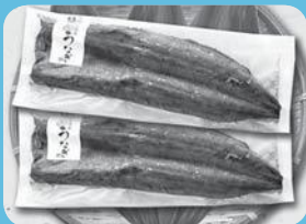
「うなぎ蒲焼き」こうさんもん No.13 緑川水系の地下水で育てた鱈の蒲焼き ▶甲佐養鰻場 ☎096-285-3452

ふるさと納税のお礼の品として贈呈している本町の特産品ブランド「こうさんもん」を紹介します。