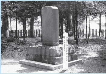
▶歴史が刻まれた緑川上流通漕碑

今でこそ、上揚地区から上流側、緑川沿いの甲佐、美里、山都地域は川に沿った道路を車で行き来していますが、江戸時代までは牛馬で行き来しており、物資の流通は小規模な石橋（広瀬旧道眼鏡橋など）や陰しく狭い山道が支えていました。物資の流通に支障を来すため、江戸時代後期には緑川の川浚を行い、上流から中流ま