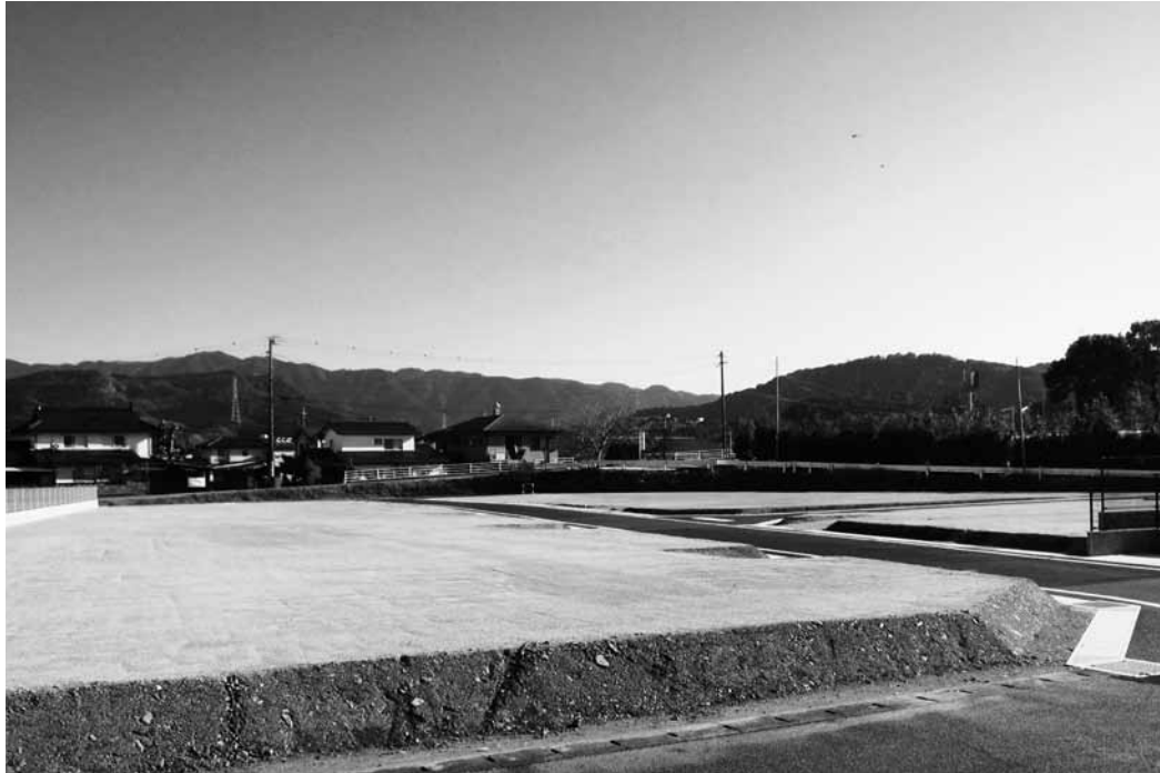
▲甲佐小学校・町役場・病院・金融機関・コンビニがすべて徒歩10分以内