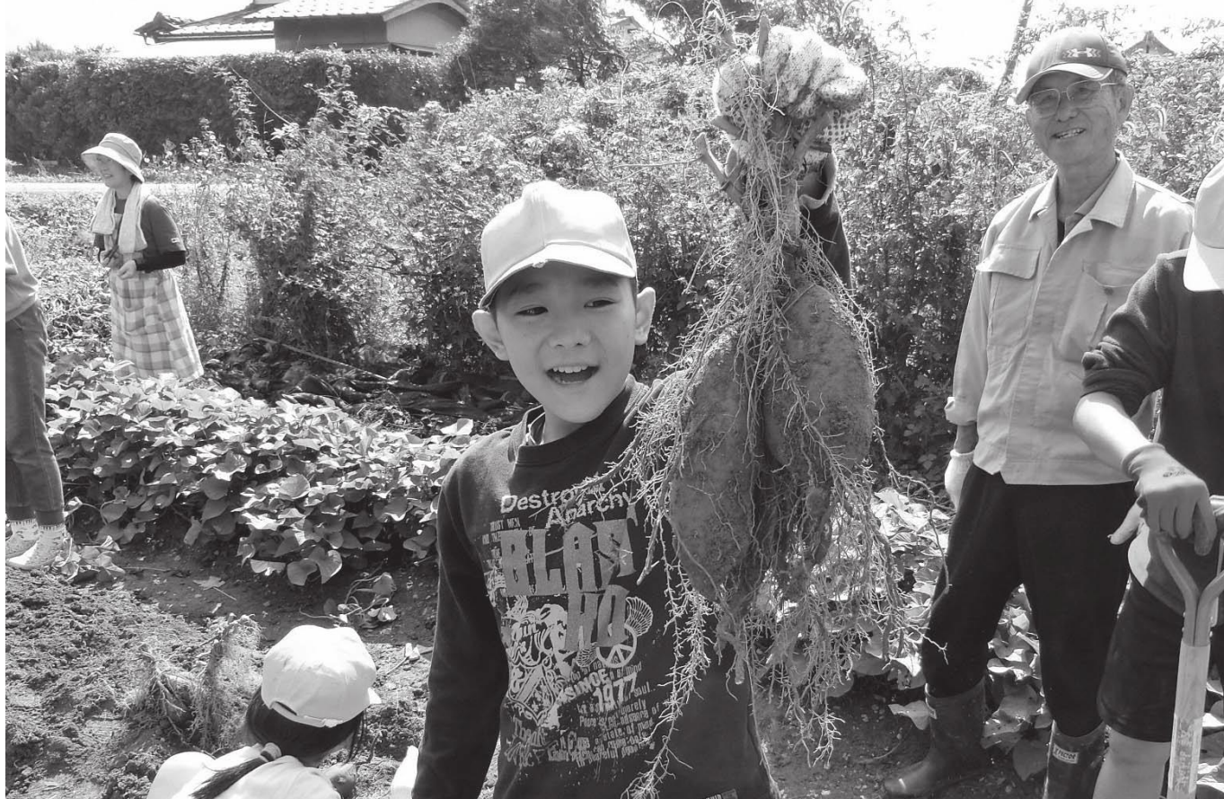
10月17日（水）豊内で、甲佐町地域学校協同活動事業として行われた甲佐小学校の芋掘り