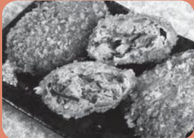
「にらメンコ。」こうさんもん No. 3 本町特産のニラを使ったこだわりメンチカツ

ふるさと納税のお礼の品として贈呈している本町の特産品ブランド「こうさんもん」を紹介します。