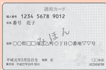
マイナンバー通知カード

平成31年2月の確定申告には、マイナンバーカードや通知カードの提示および申告書へマイナンバーの記載が必要となります。通知カードは捨てたり破ったりせず、大切に保管してください。