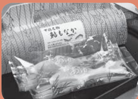
「あゆもなか」こうさんもん No. 4 甲佐の鮎をかたどった最中