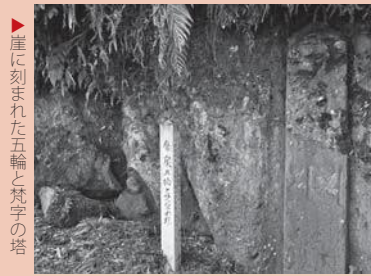
崖に刻まれた五輪と梵字の塔

村の古老の話では、この場所にある由来などはよく分からないそうです。ここは、緑川によってけずられた阿蘇火砕流の崖が直立しており、崖は加工のしやすい溶結凝灰岩（ようけつぎょうかいがん）です。そのために文字や絵を刻み込みやすかったと思われます。