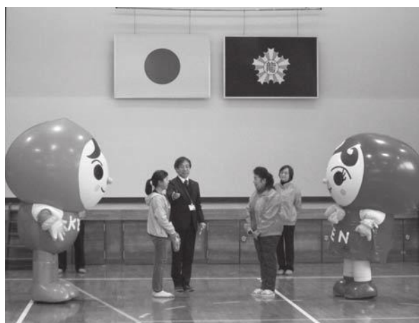
◀児童から人権擁護委員に花の種を贈呈