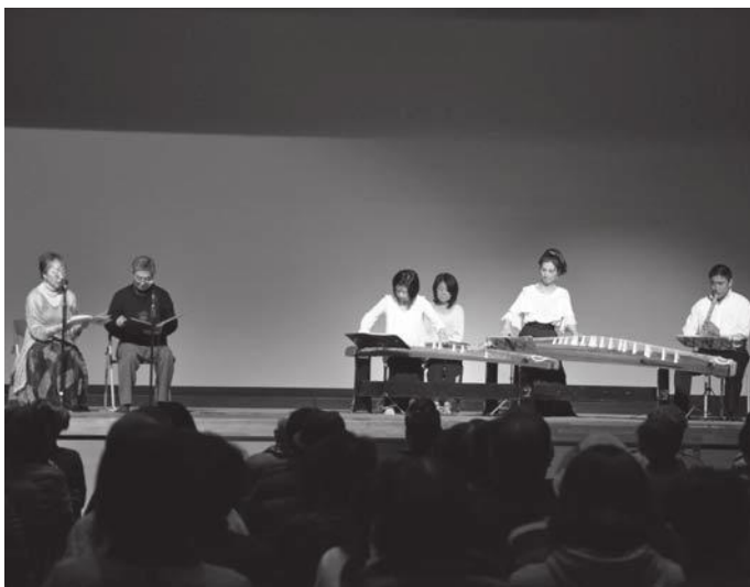
▲和楽器の演奏にあわせて、「かさじぞう」や甲佐町の民話を朗読。来場者は響き渡る音色と物語の世界に引き込まれました