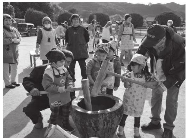
▲もちつきを教わりながらきねを振る園児たち