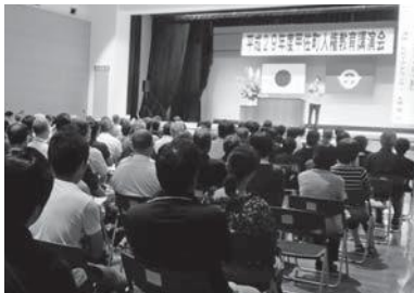
多くの皆様のご参加をお待ちしています

甲佐町人権教育推進協議会（町教育委員会社会教育課内） ☎096-234-2447（内線324）