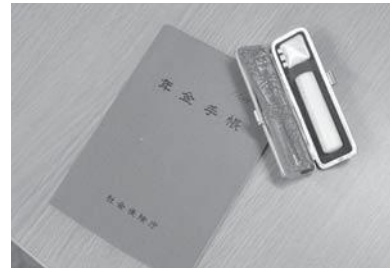
詳しくは町住民生活課にお問い合わせください