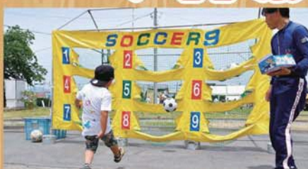
★キックターゲット