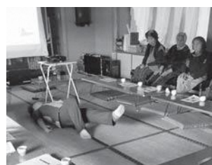
▲介護予防のための足のストレッチなどを学ぶ参加者

小麦粉を米粉に、牛乳を豆乳に変えた豆乳グラタンや豆乳マヨネーズ、しょうゆサツマイモの蒸しパン、鶏の胸肉を使った鶏チリなどヘルシーなメニュー5種類を作り、会話をしながら楽しく試食をしました。