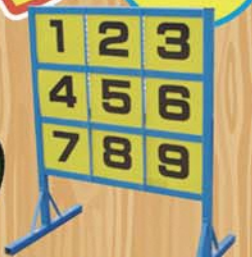
★ストラックアウト