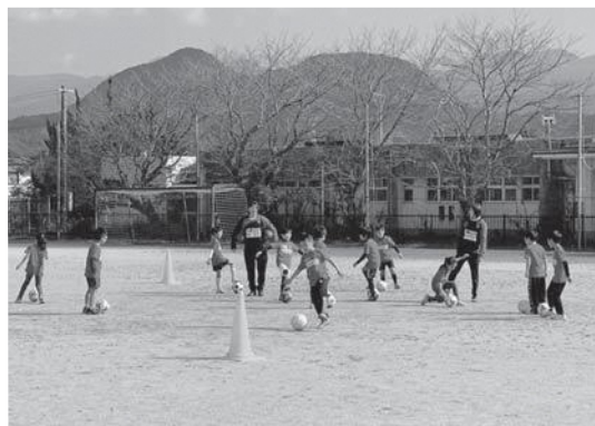
▲甲佐小で行われたサッカー教室

また甲佐小学校では、女子サッカーの熊本ルネサンスフットボールクラブの選手を講師にサッカー教室を開催、44人が参加しました。