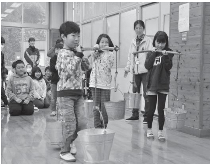
▲てんびん棒を使ってバケツに入った水をこぼれないように慎重に運ぶ児童たち