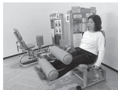
▲下肢筋力の基本となる筋肉を鍛えることができます。

4月4日（木）に、フィットネスセンターは2周年を迎えます。当日は、記念イベントを実施しますので、お友達などお誘いあわせの上お越しください。