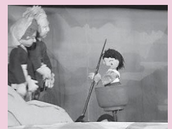
人形芝居を開催します

町生涯学習センター自主文化事業として「かすぺる」の人形芝居『いっすんぼうし』を開催します。入場は無料です。どなたでも参加できます。ぜひご来場ください。