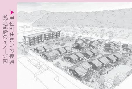
▶甲佐町住まいの復興拠点施設のイメージ図