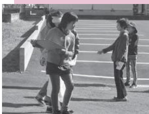
上：完成した危険箇所マップの発表を行う参加者 中：班ごとに地域を歩きながら危険箇所を1つ1つ確認 下：防災士の指導の下、マップを作成