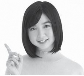
国保イメージキャラクターの上白石萌歌さん