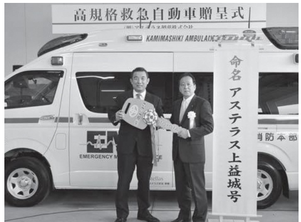
▲福島室長（左）から奥名管理者に目録を贈呈