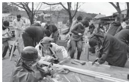
▲多くの人が参加した改修ワークショップ

また、「知らない人との交流が面白かった」「他県の人たちから専門的な話を聞けた」という感想も聞かれ、改修ワークショップを通じて地