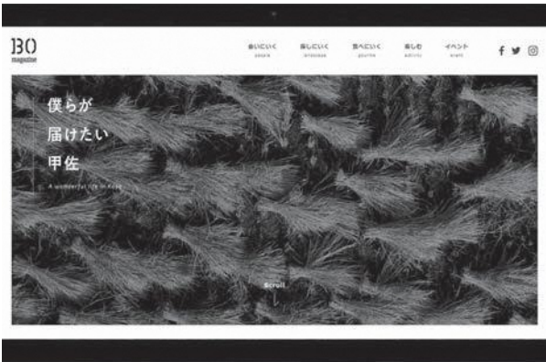
▲甲佐町まちづくり協議会のウェブサイト制作中

タウン希望者への対外的な発信はもちろん、町内の皆さんにも、本町の課題や魅力などを分かりやすく伝えていく予定です。