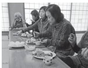
▲作った米粉料理を会話しながら楽しく試食する参加者

持ちの方でもおいしく食べられる料理を提案しました。メニューを1つずつ説明しながら調理していくデモン