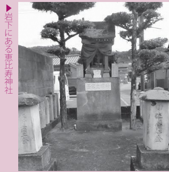
▶ 岩下にある恵比寿神社

周囲の集落からの移住は続き、天和元年(1681)年には戸数60と記録されている。商いの神を勧進(かんじん)したのは商業の街として発展しようとの目論見(もくろみ)があったと思われる。(つづく)