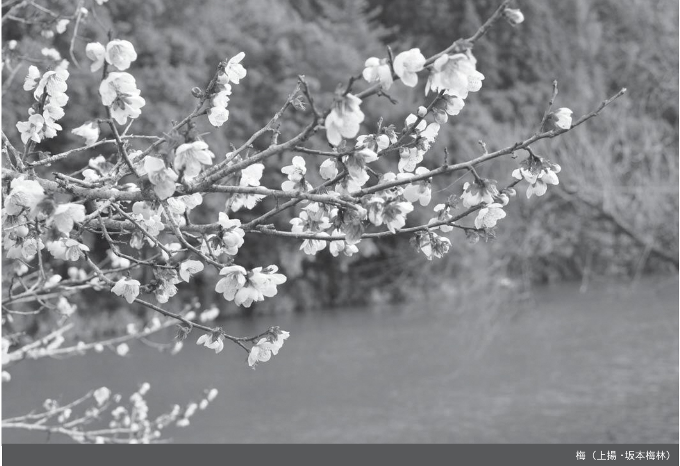
梅（上揚・坂本梅林）