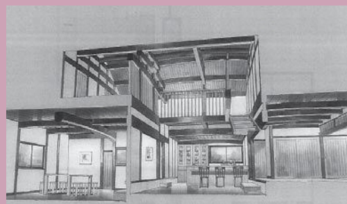
◀旧西村邸改修後のイメージ図