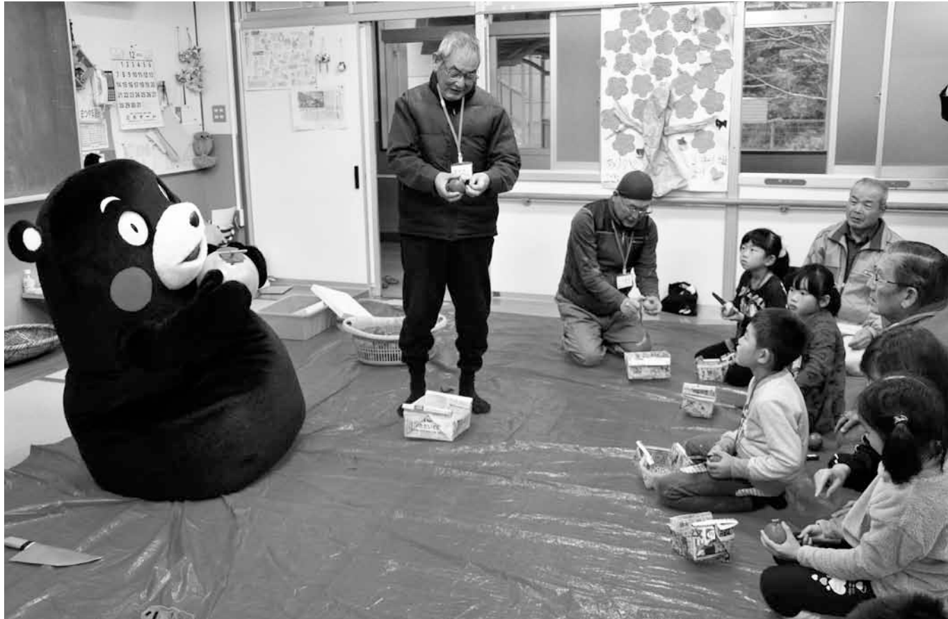
12月3日（水）放課後子ども教室「乙女小まつやま塾」で、くまモンと一緒に干し柿作りを体験する子どもたち