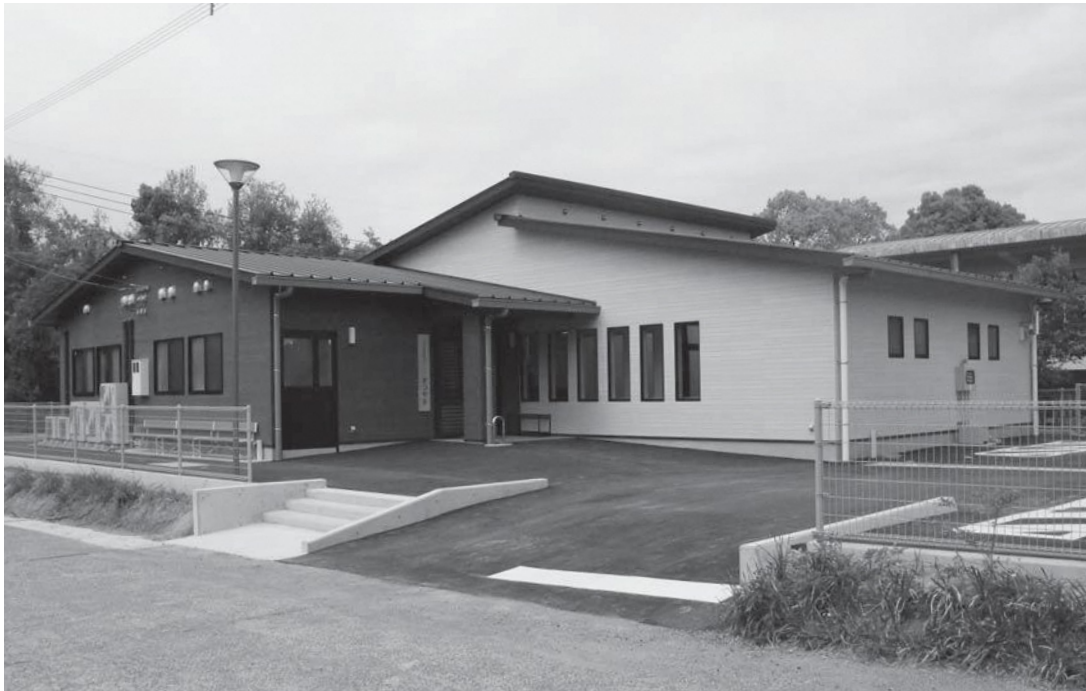
乙女小学校の東側に完成した乙女高齢者福祉センター「まつやま」