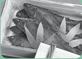
「鮎の甘露煮」こうさんもん No.1 新鮮なアユを甘辛く煮た一品 ▶ (有) 守口屋 ☎096-234-0016