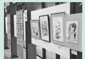
◀「公民館自主講座作品展」は5月11日(土)まで