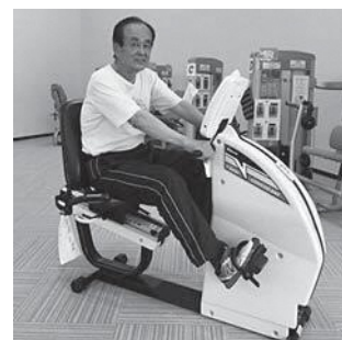
▲フィットネスセンターには5台のエアロバイクを設置しています。

走る前に筋トレを行うことです。フィットネスセンターには筋力トレーニングマシンも設置しております。薄着になる季節の前に、効率よく脂肪を燃焼させましょう。