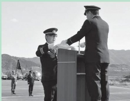
▶ 消防庁長官表彰などを伝達