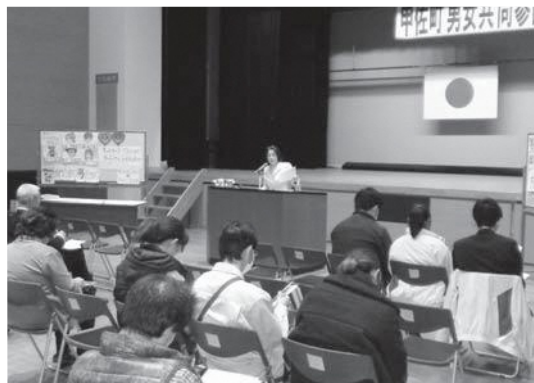
▲町生涯学習センターで開催された男女共同参画講演会

参加した約60人は「男女間での暴力のない対等な関係の築きかた」などについて考えを深めました。