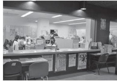
詳しくは町住民生活課へお問い合わせください