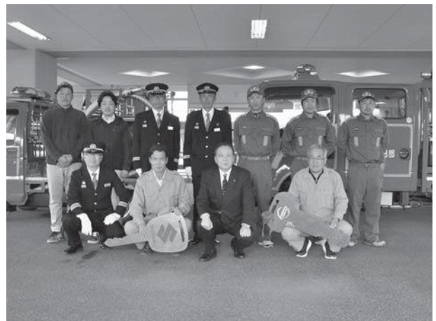
◀積載車の引き継ぎを受けた2地区の区長ら