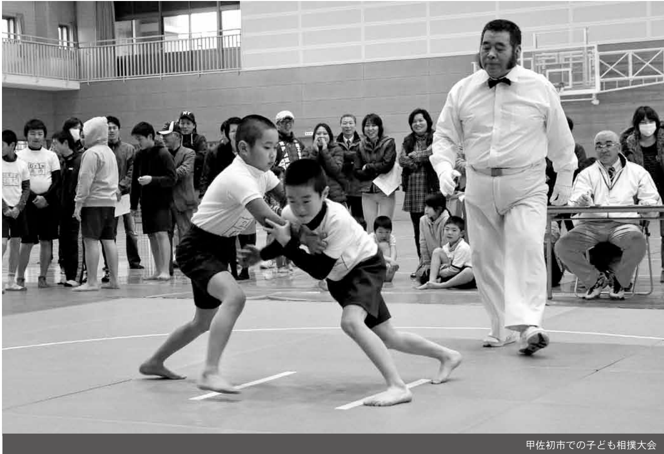
甲佐初市での子ども相撲大会