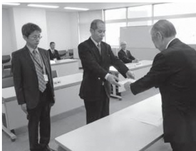
▲併任職員の辞令交付に臨む本町税務職員