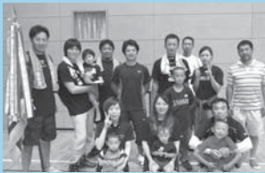
▶優勝した「商工会A」チーム