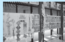
◀7月の展示会 龍野小学校児童作品展

●お問い合わせ先 町教育委員会社会教育課 ☎096-234-2447 ✉k1g110@town.kosa.lg.jp