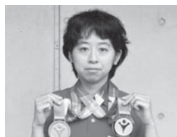
一圓舞選手 (津志田区)

7月にアメリカで開催された2015年スペシャル・オリンピックス夏季世界大会水泳25 ㍓ 自由形で銀、同背泳ぎで銅メダルを獲得。