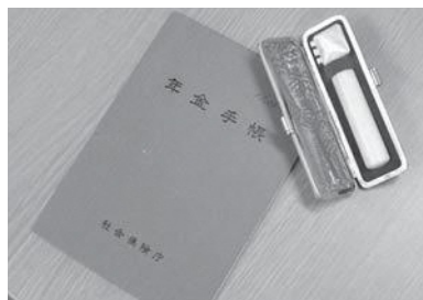
詳しくは町住民生活課へお尋ねください