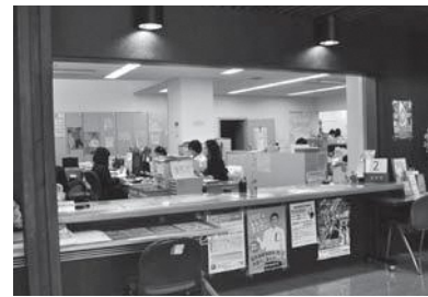
詳しくは町住民生活課へお尋ねください

負担金割合（今まで高齢受給者証に記載されていた内容）が記載されており、70歳の誕生日の属する月の翌月1日（ただし1日生まれの方は当日）から使用できます。自己負担割合は、所得区分が「一般」「区分Ⅱ」「区分Ⅰ」の場合が2割、「現役並み所得者」の場合が3割です。