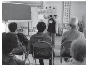
▲食中毒の原因と予防の方法を学ぶ参加者

細菌は温度や湿度などの条件がそろうと食べ物の中で増殖し、それを人が食べることで食中毒を引き起こし