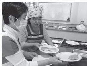
▲パンケーキやどら焼きの調理を楽しむ参加者

パンケーキ作りでは、泡がつかないように混ぜて作ったメレンゲをホットプレートに盛り、少量のお湯