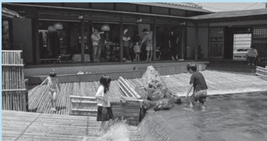
▲普段と異なるやな場を楽しむ町内外から訪れた参加者

初めて訪れたという熊本市中央区の親子は「SNSを通してイベントを知りました。もともと甲佐のやな場には興味があったので、今回来てよかったです。雰囲気があっていいですね」と流れ落ちる水音とあずま屋が醸し出す風情を楽しみました。