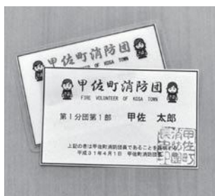
▲登録店舗でのサービス利用には、消防団員証の提示が必要です。