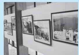
◀6月の「伊藤一男写真展」の様子