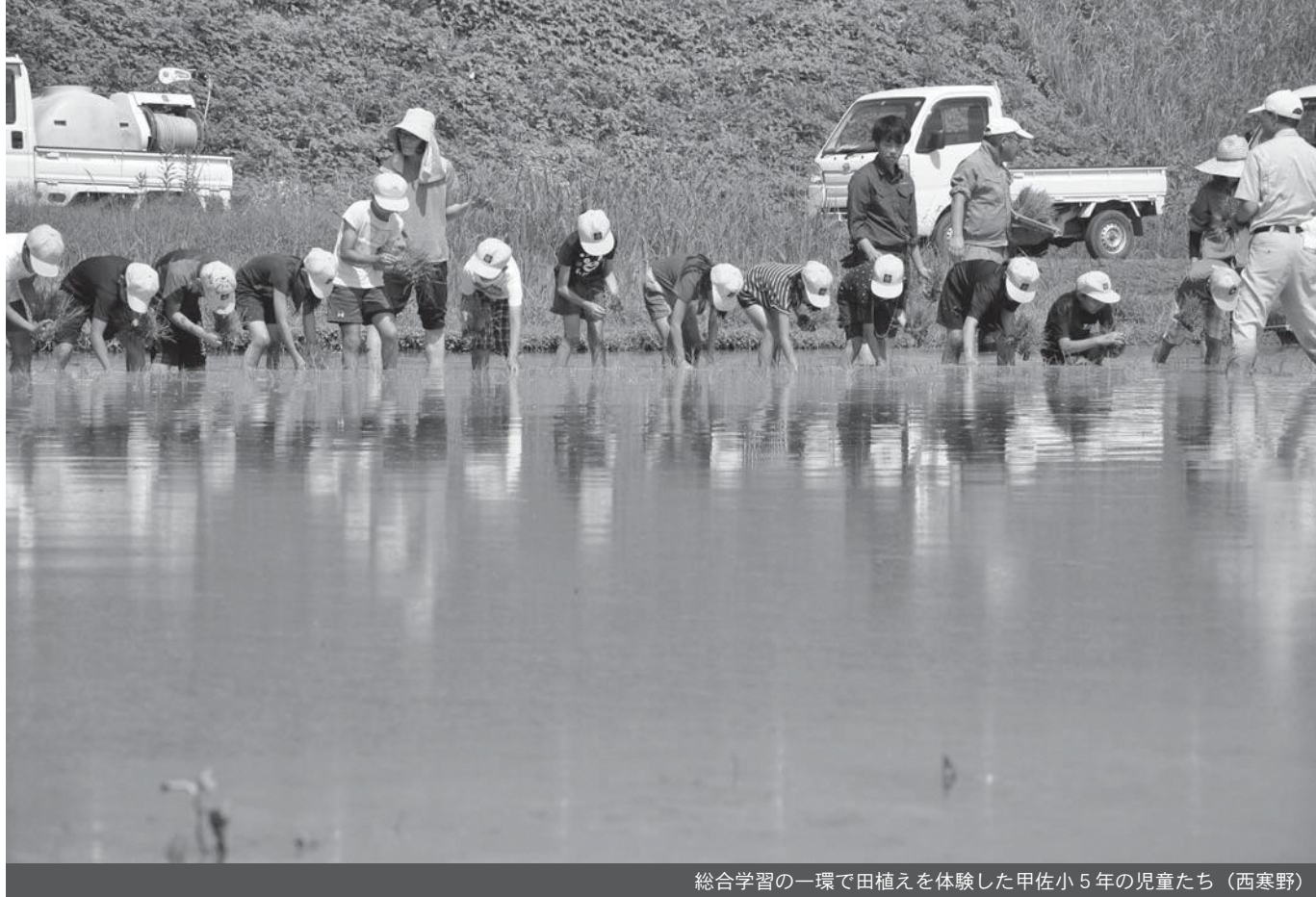
総合学習の一環で田植えを体験した甲佐小5年の児童たち（西寒野）