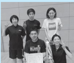
▶優勝した緑町(左)とスウィートフィッシュの皆さん