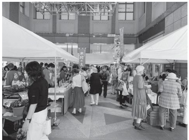
▲びふれす広場で本町の特産品を手取る来場者