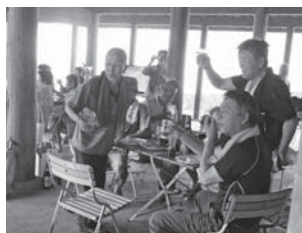
▲宮内地区の住民らが夏の風物詩である夏祭りを楽しんだ

で採れたシイタケや野菜などいろいろな食材を使ったバーベキューに舌鼓を打ち流れる汗をぬぐいながら冷