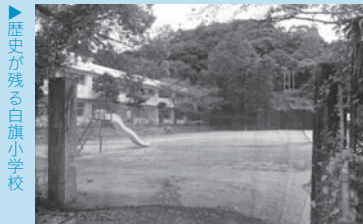
歴史が残る白旗小学校

明治7（1874）年の学制により、各地に小学校が造られるようになりました。白旗小学校も、その時からの歩みで現在に至っています。