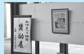
◀8月の展示会 あゆまっつり共催作品展

●お問い合わせ先 町教育委員会社会教育課 ☎096-234-2447 ✉klg110@town.kosa.lg.jp