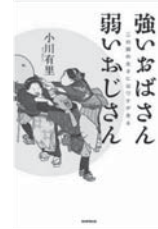
毎日新聞出版 一般書

女性の平均寿命が85歳を超えた今、老いを受け入れながらもいずれ訪れる「おひとりさま」生活への心構えや、「サラリーマン」引退後の伴侶との生活を快適に過ごすための知恵がちりばめられています。寄る年波にあらがいつつも、たくましく生きるシニア世代の妻の本音、夫の本音がたっぷり詰まったおすすめの爆笑エッセイです。