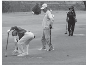
▲交流を深めながらグラウンド・ゴルフを楽しむ参加者

な秋風の吹く中、3コースを回り練習の成果を発揮しました。額に心地よい汗を浮かべ和気あいあいとプレ