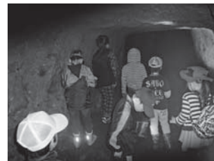
▲暗い洞窟を懐中電灯で照らしながら探検する子どもたち

物が出て来るかと不安な表情を浮かべていましたが、慣れてくると興味津々でいくつかの脇道まで電気を照らし、天井にぶら下がっているコウモリやゲジゲジを観察しました。探検後には、町生涯学習センター図書室で探検に見つけた生き物などの特徴を図鑑で調べました。