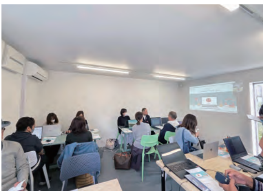
▲パワーポイントや生成 AI について学ぶ受講生たち