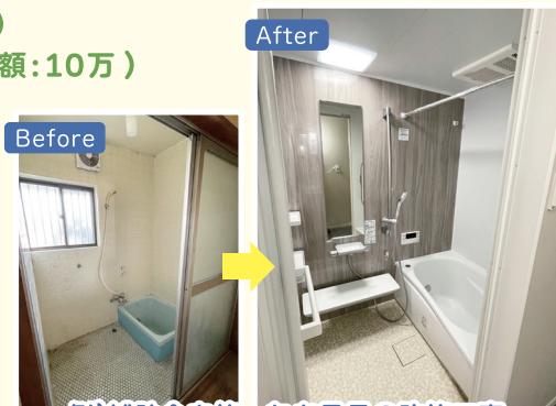
例)補助金を使ったお風呂の改修工事