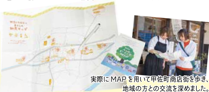
実際にMAPを用いて甲佐町商店街を歩き、地域の方との交流を深めました。

3月8日(日)、甲佐町に新しくできた福祉施設「ジョージパーク」にて、ウェルビーイングマップ交流会・写真展が開催されました。当日は、社会人吹奏楽部による演奏が行われ、心地の良い空間のなか、普段交流のない世代間での自然な対話が生まれました。