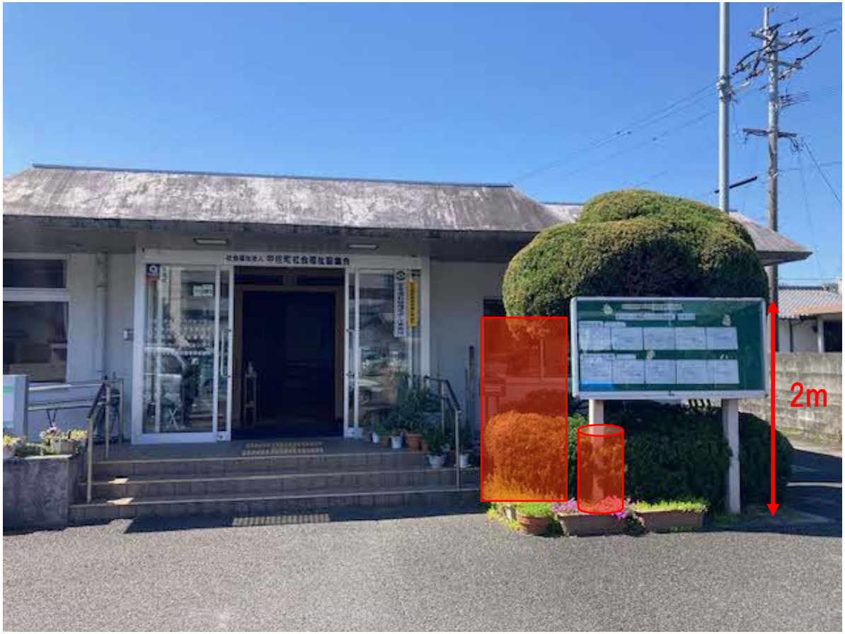
設置イメージ (近景)