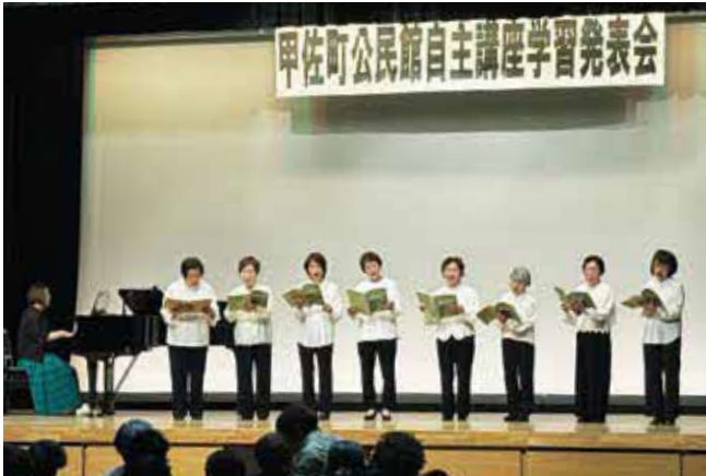
▲ステージ発表で美しい歌声を披露する町民コーラスの皆さん

4月18日(土)、町生涯学習センター・ホールおよびギャラリーモールで町公民館自主講座学習発表会が開催されました。