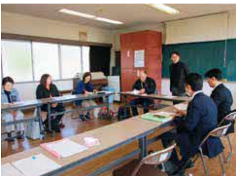
▲町民センターで行われた就学前部会総括会