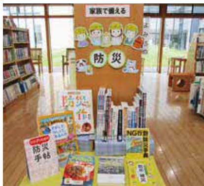
▲大切な命や生活を守る手助けとなる本を集めた「家族で備える防災」コーナー