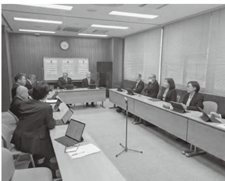
議会活性化調査特別委員会の様子

全国的な賃金上昇や近隣町村の動向を調査研究しながら、今後、委員会内で意見の集約を図っていくこととした。