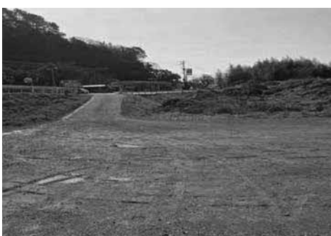
町営緑川グラウンドの様子

令和7年度1月末時点で利用件数は160件、利用者数は5198人で、利用団体の種目は、主にグラウンドゴルフとサッカーで、その他として白旗小学校のイベントや町消防操法大会時の練習で利用があつている。