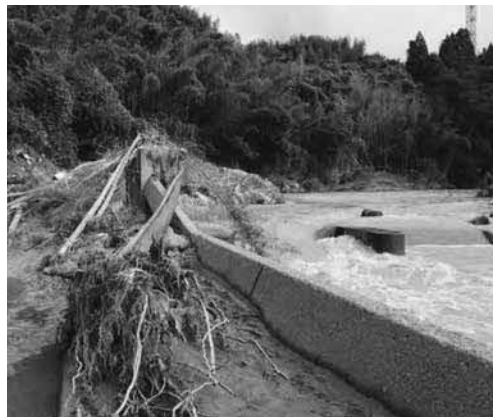
鹿生田堰（西寒野区）の被災状況