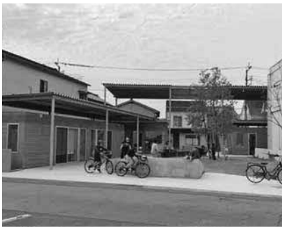
甲佐町起業等応援施設