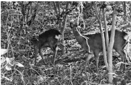
被害をもたらす野生のシカ

問 有害鳥獣の被害は年々増加傾向にあるが、駆除対策と駆除隊加入促進への免許取得補助は。