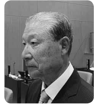
鳴瀬 美善 議員