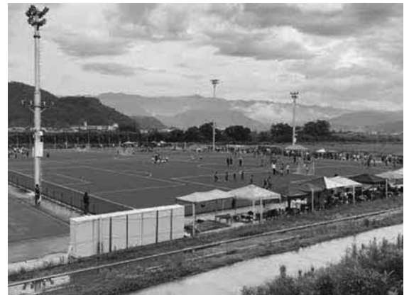
熊本甲佐総合運動公園