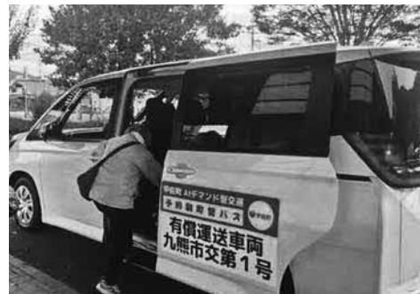
試験運行中の予約制町営バス