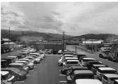
役場駐車場の様子