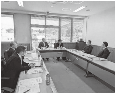
鹿児島県さつま町議会研修の様子