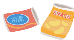
食品袋・お菓子の袋