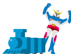
おもちゃ・プラモデル