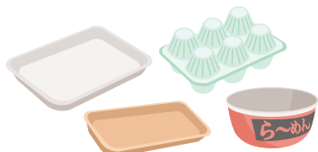
食品パック・食品トレイ